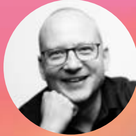
HERAUSGEBER GERALD PICHLMAIR